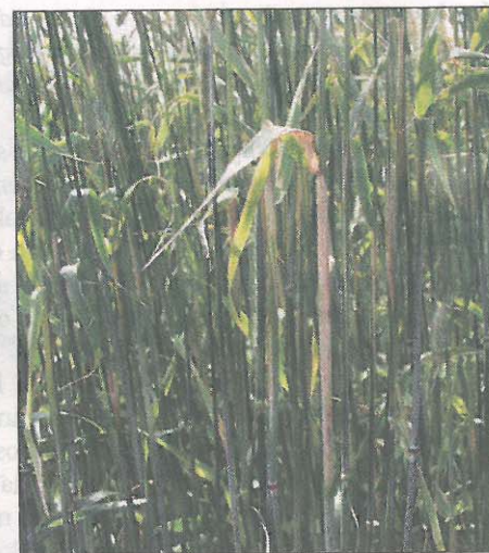
Angreb af trips i rug. Bladskederne bliver brune, og skaden kan være større end for luseangreb.