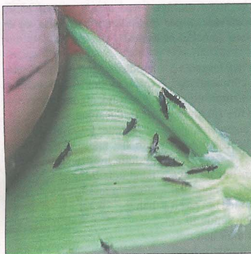
Trips i bladskederne.